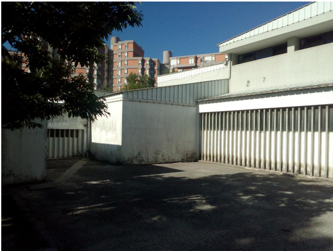
FIGURA 4 – Parte do pátio do Jardim de Infância vista lateralmente