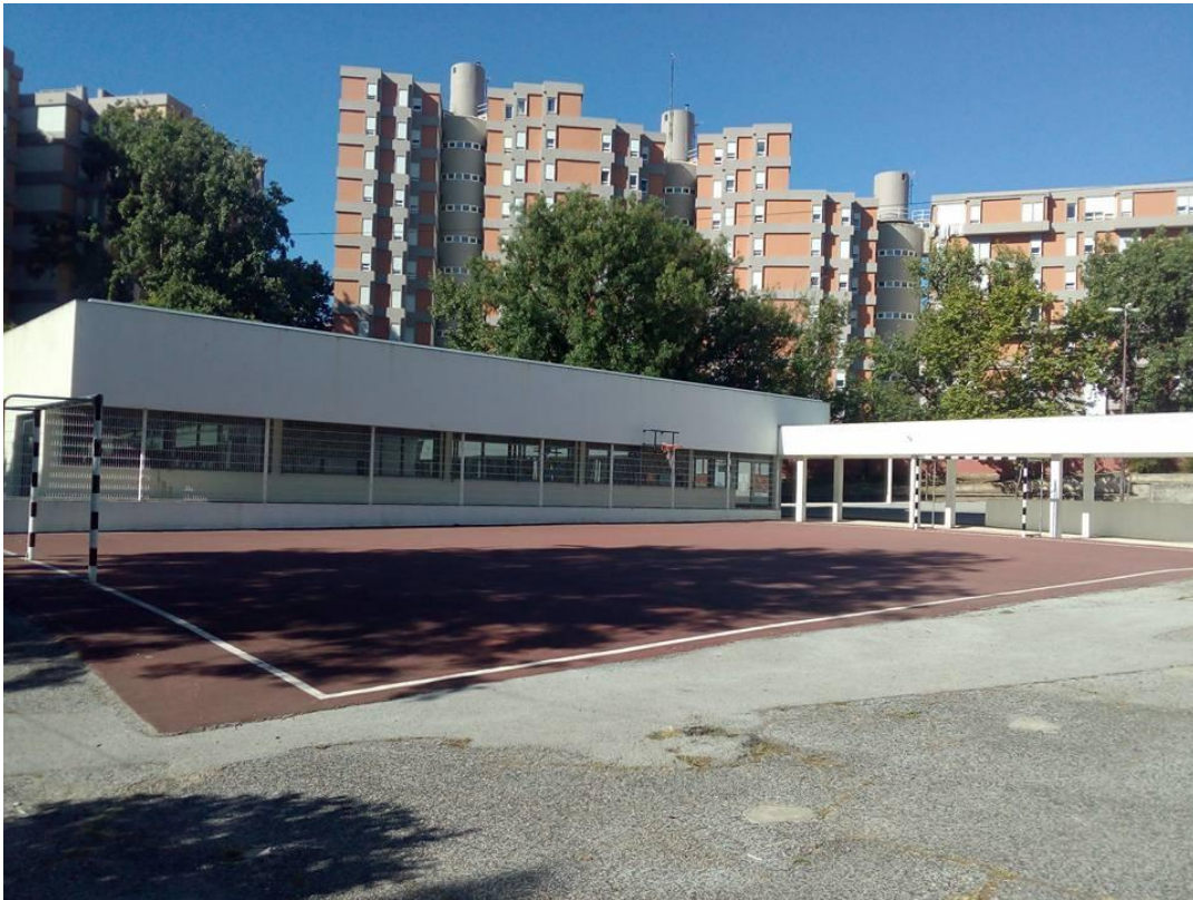
FIGURA 6 – Campo de Fútbol visto lateralmente