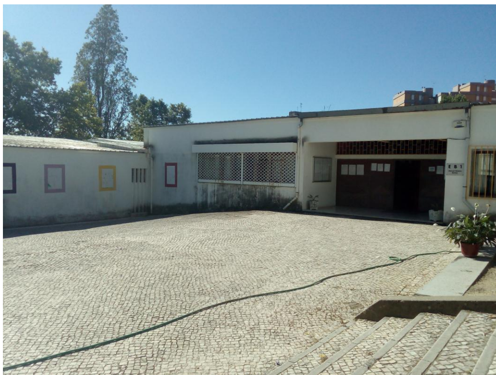
FIGURA 3 – Entrada do Pavilhão central vista lateralmente