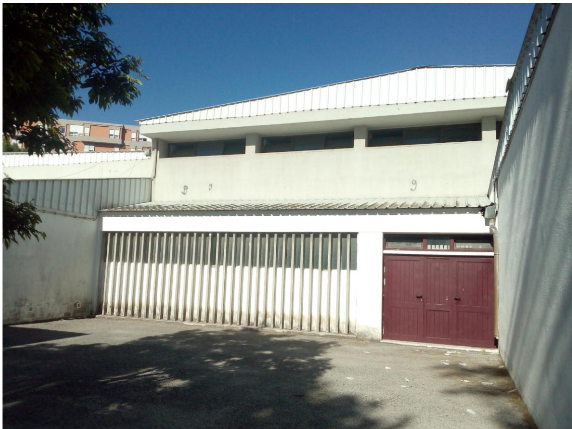
FIGURA 5 – Parte do Pátio do Jardim de Infância vista de frente