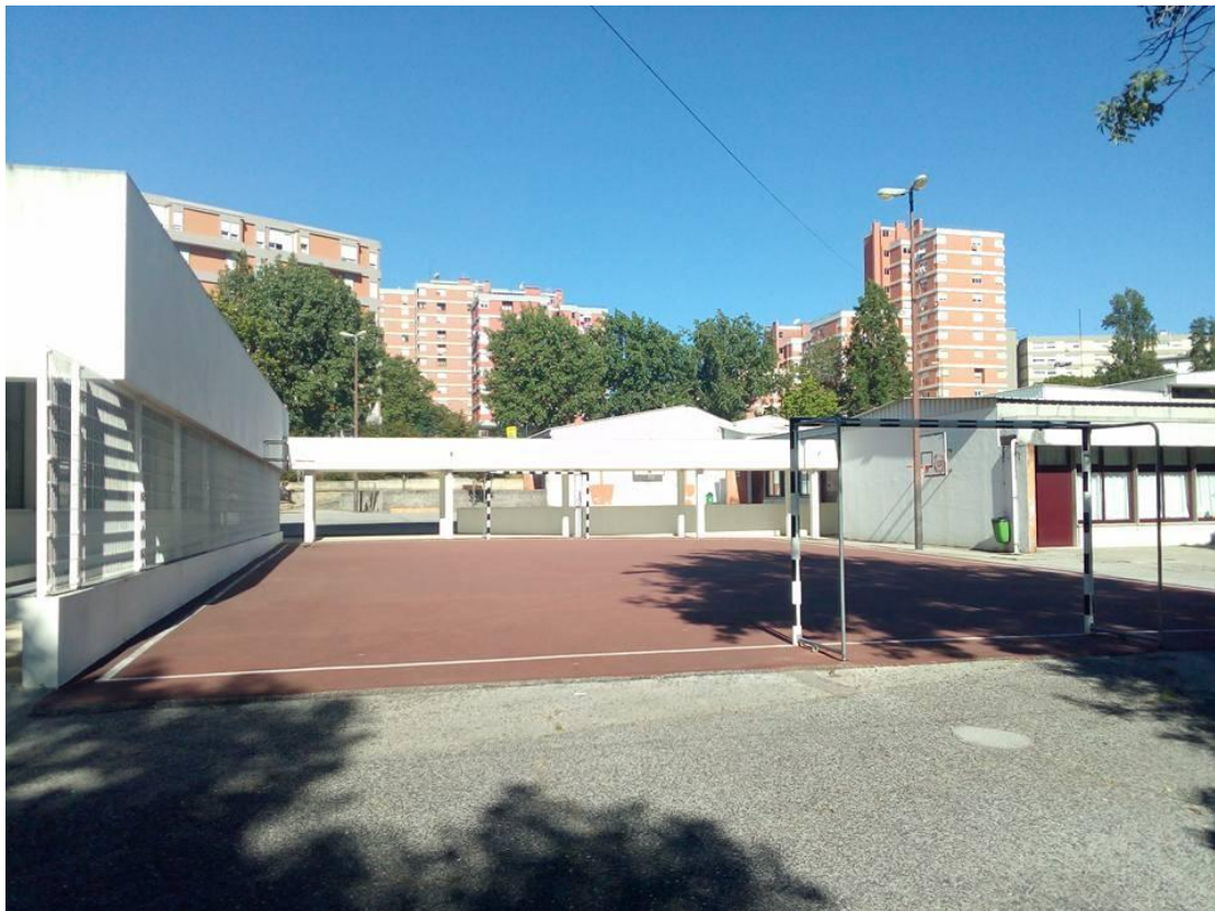
FIGURA 7 – Campo de Fútbol visto de frente