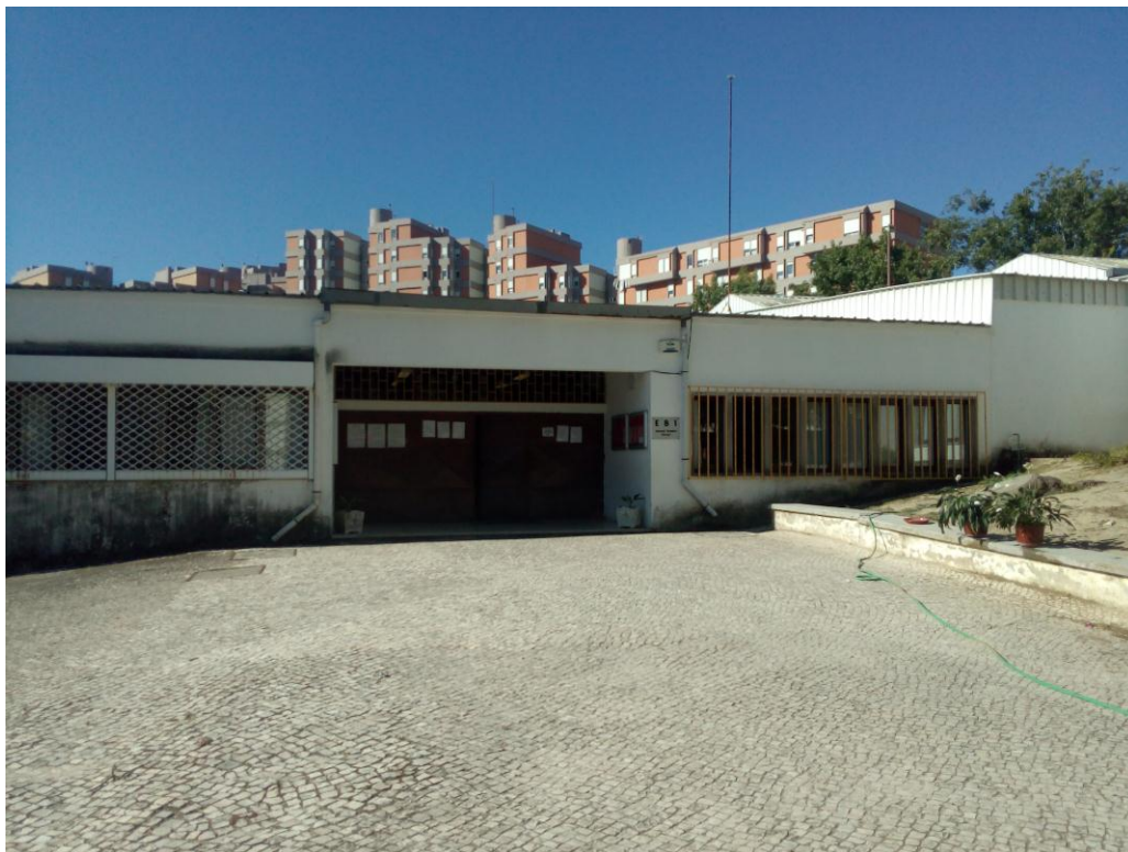
FIGURA 2 – Entrada do Pavilhão Central vista de frente