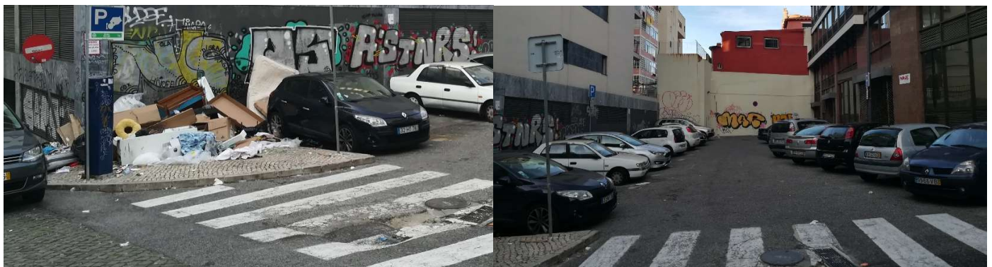
Fig. 2 – Aspeto do espaço da proposta

Como as imagens mostram, o que se passa na zona é um atentado à saúde pública e à segurança dos cidadãos, já que dificilmente se pode circular pelos passeios ou usar a passadeira.