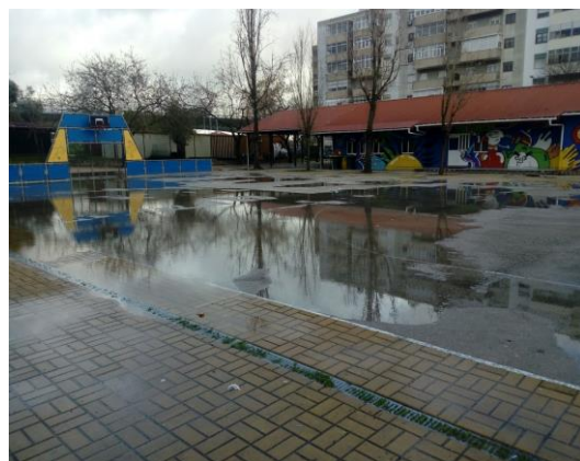
Campo de jogos coberto com água em dia de chuva