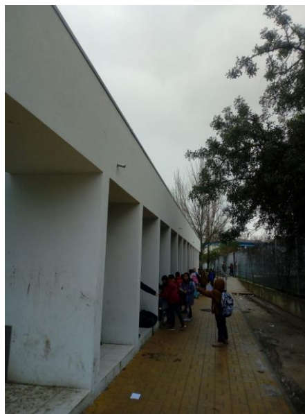
Entrada das salas de aula que têm acesso direto ao recreio

Pretendíamos também a construção de um pavilhão/telheiro na parte posterior da escola. Este seria uma importante melhoria pois criaria um espaço de recreio coberto para dias de chuva e, ao mesmo tempo, daria apoio às expressões motoras curriculares e às atividades de enriquecimento curricular desportivas.