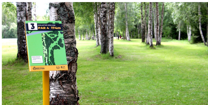
Exemplo de sinalética de uma estação de Disc Golf em Skellefteå, Suécia