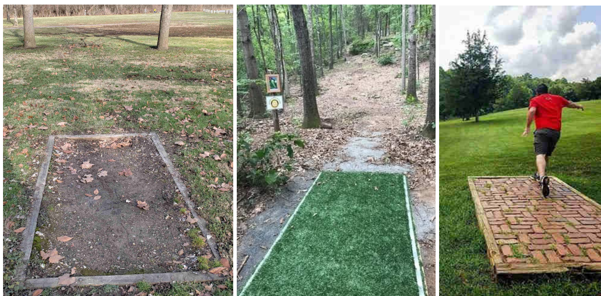
Exemplos de diferentes alternativas para as bases de partida (tee)