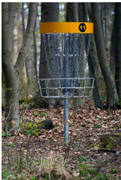
Exemplo de um cesto de Disc Golf