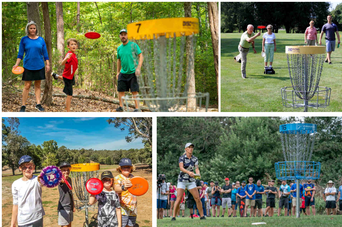
Exemplo de diferentes grupos a praticar DiscGolf

A prática de Disc Golf ocorre um pouco por todo o mundo, seja a nível amador quer profissional.